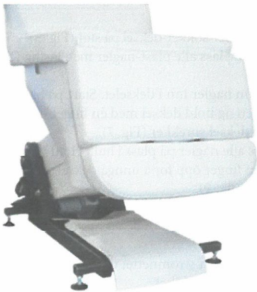
Fig. 4: Stol ved levering