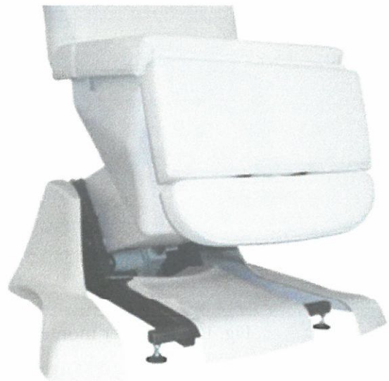
Fig. 5: Posisjon til fot-deksel