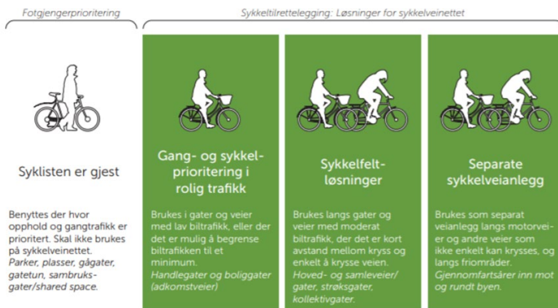
Figur 1 Prinsipper for løsninger i sykkelveinettet hentet fra Oslostandard for sykkeltilrettelegging.

Løysingane i planen krev fråvik frå vegnnormalane som enno ikkje er handsama, og vi har derfor atterhald om at løysingane for sykkelfelt i planen vert godkjent. Dersom fråvik ikkje vert godkjent, må vi jobbe vidare med løysingane.