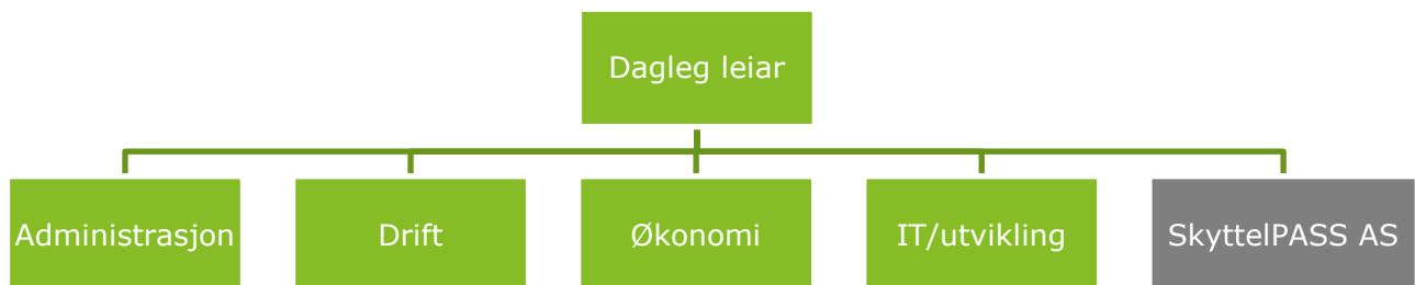
Figur 2: Forenkla organisasjonskart 21

Selskapet er leia av dagleg leiar. Dagleg leiar har ei mindre, uformell leiargruppe beståande av seks leiarar som skal rapportere til han. Leiargruppa skal i regelen møtast kvar veke, men dagleg leiar medgjev at dei ikkje alltid får til dette. Han fortel at om det er noko vesentleg som må drøftast, skal det vere låg terskel for leiargruppa å ta direkte kontakt med han. Møta i leiargruppa er i hovudsak munnlege.