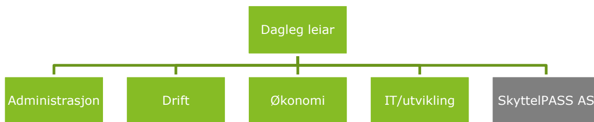
Figur 1: Forenkla organisasjonskart 8

Verksemda til Skyttel er i dag i hovudsak knytt til driftsoperatørkontraktar selskapet har for tre bompengeprojekt, kontrakten som sentral tenesteleverandør for AutoPASS-ferje, samt ein del mindre kontraktar, t.d. knytt til billettering på eit ferjesamband og bompengeadministrasjon for storforbrukarar.