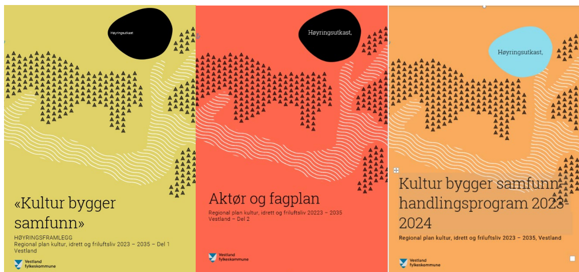
Del 1: Temaplan