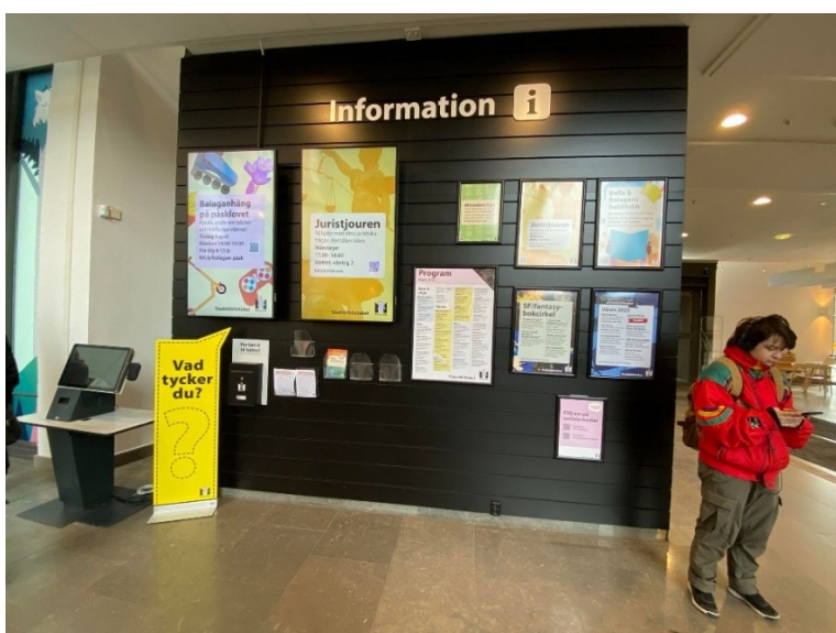
Bilde 12 - Her er same informasjonstavle/vegg i Malmö Stadsbibliotek.