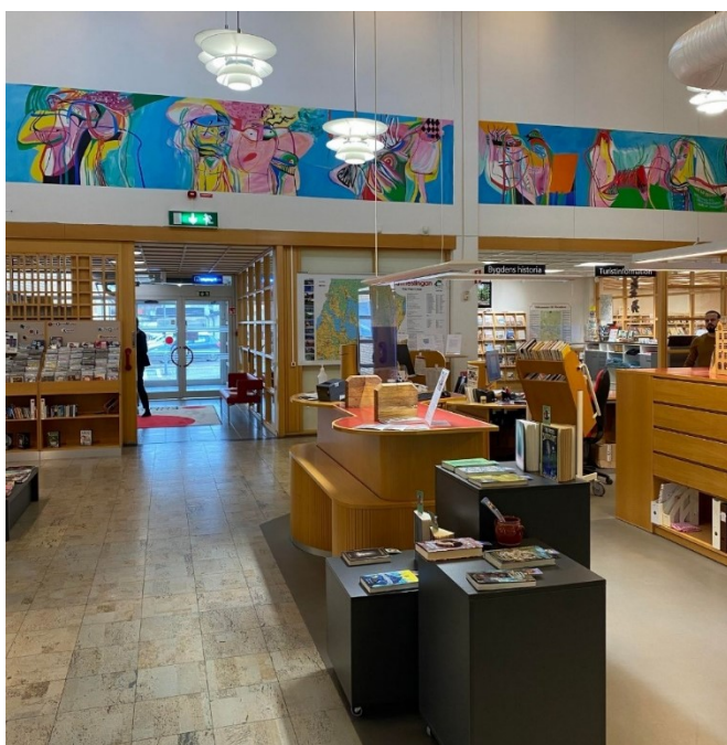
Bilde 14 - Skrankeområdet i Bromölla bibliotek