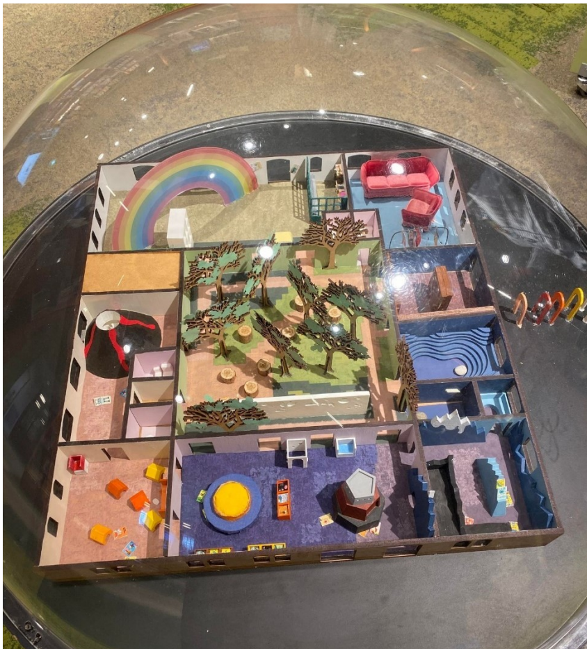
Bilde 10 - Ei fin oversikt over heile barneavdelinga i Malmö Stadsbibliotek.