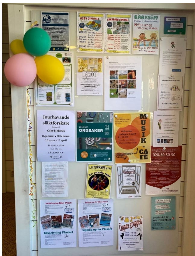
Bilde 6 - Tavle med oversikt over arrangement og andre aktivitetar

Det finns også ein felles kulturkatalog ( https://www.osby.se/se-gora/kultur.html ) der det meste av kulturprogrammet for heile Osby kommune blir lagt ut, inkludert dei faste arrangementa til biblioteket. Denne katalogen blir gitt ut tre gongar i året: vår, sommar og haust.