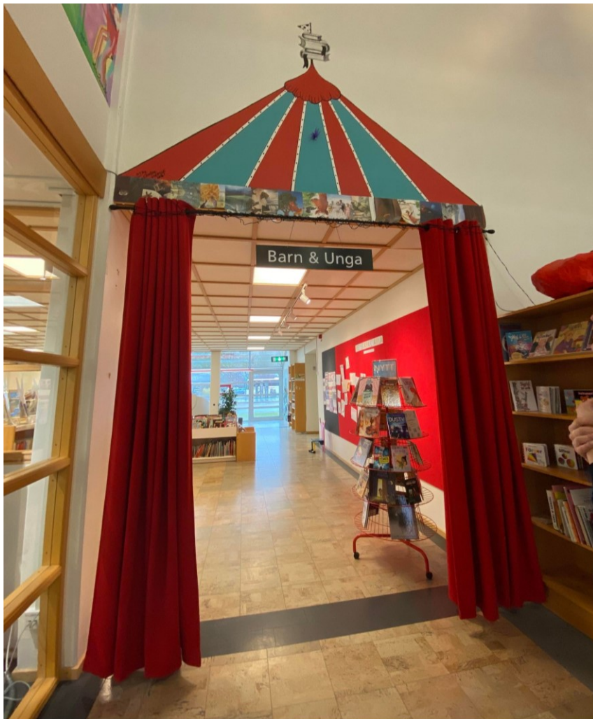
Bilde 15 - Inngangen inn til barn- og ungdomsavdelinga i Bromölla bibliotek