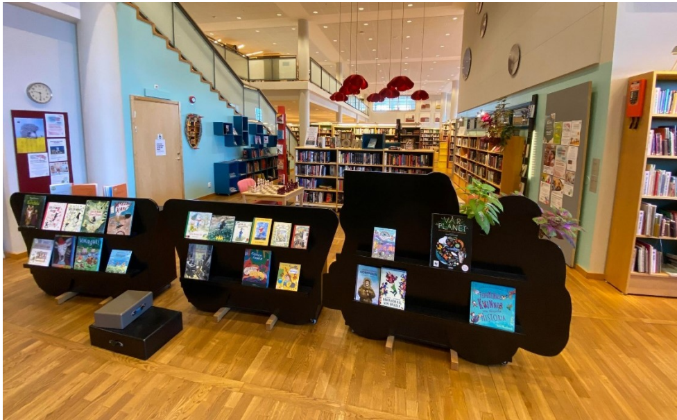
Bilde 4 – Utstillingshylle forma som tog. Dei raude lampane er laga med lyddepande stoff kan du sjå her øvst i bildet.