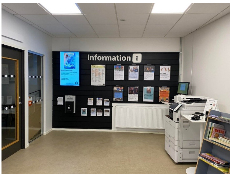
Bilde 11 - Informasjonstavle/vegg på Oxiebiblioteket. I Sverige arbeidar dei med å få ei informasjonstavle/vegg som er heilt like på alle bibliotek.

Oxiebiblioteket gjer det veldig likt som Osby bibliotek, men er meir aktive på Facebook-sida si og leggjar ut arrangementa sine her, i motsetning til Osby som er mest aktive på Instagram. Det finns ein felles arrangementskalender for alle biblioteka i Malmö i tillegg til andre aktørar i kommunen ( https://evenemang.malmo.se/en ). Dei er også aktive på Instagram.