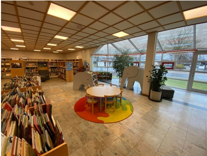
Bilde 17 - Barneavdelinga i Bromölla bibliotek