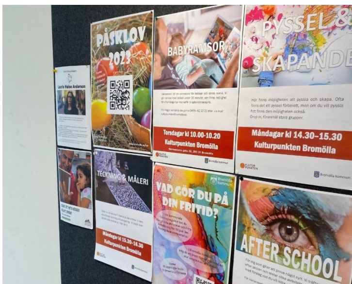
Bilde 20 - Tavle med oversikt over arrangement og aktivitetar

For vaksne har dei arrangement som Pyssel- och hantverksträffar der dei oppfordrar vaksne til å møte opp på biblioteket for å sitte saman å prate og drive med handarbeidet sitt.