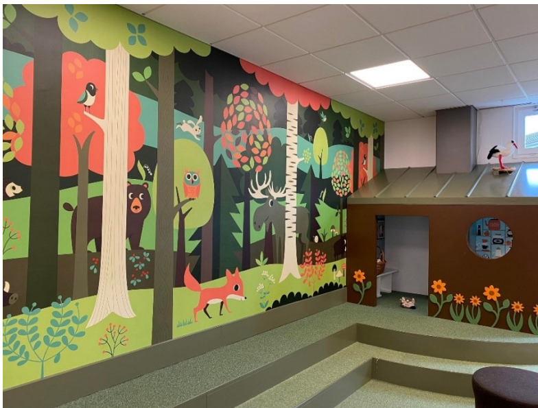
Bilde 7 - Barneavdelinga i Oxiebiblioteket

Oxiebiblioteket er eit av ni bibliotek i Malmö, og ligg midt i Oxie sentrum.