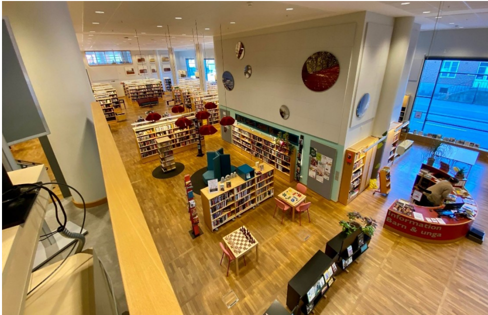
Bilde 2 – Ungdomsavdelinga, og bakover i bilde kan ein sjå litt av vaksenavdelinga.

Gjennom heile arbeidsprosessen har brukarmedverking vert veldig viktig. Covid-19 gjorde dette litt vanskelegare då dei måtte stenge biblioteket i ei periode. Fram til nedstenginga arbeida dei med å få direkte respons frå brukarar, både barn, ungdommar og vaksne. Samtidig som Covid-19 satt sine grenser for denne brukarmedverkinga, opna også nedstenginga opp for at dei tilsette hadde meir tid til dette prosjektet utan å måtte tenke på konsekvensane av å stenge av deler av biblioteket, eller heile biblioteket.