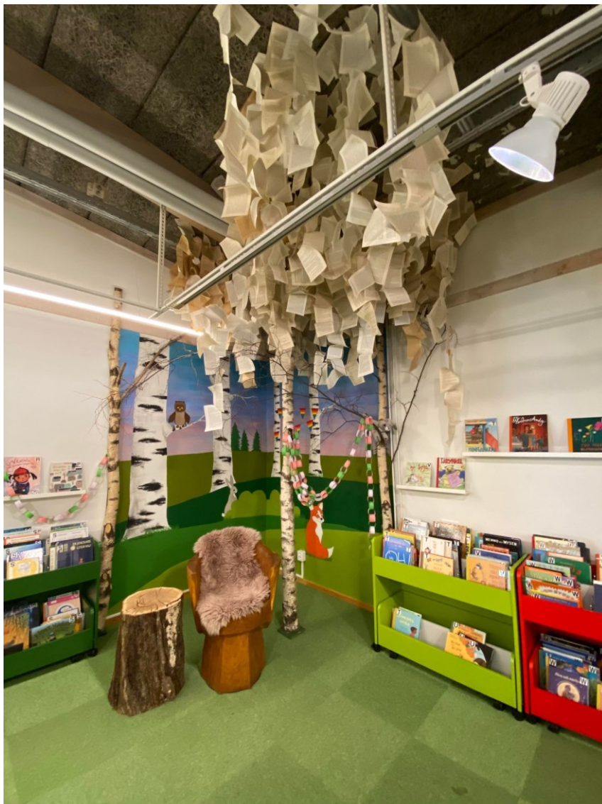
Bilde 5 - Barneavdelinga i Osby bibliotek