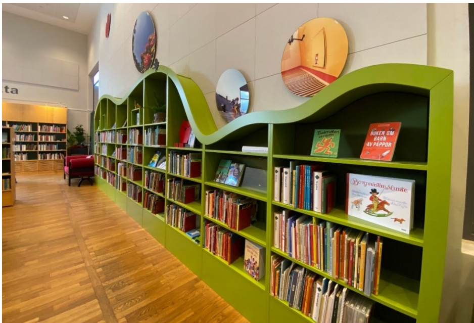
Bilde 3 - Faktahylle på barneavdelinga. Trekt over ryggen på hylla er eit lyddepande stoff som har hjelpe med å dempe lyden i heile biblioteket.

Gjennom heile arbeidsprosessen har brukarmedverking vert veldig viktig. Covid-19 gjorde dette litt vanskelegare då dei måtte stenge biblioteket i ei periode. Fram til nedstenginga arbeida dei med å få direkte respons frå brukarar, både barn, ungdommar og vaksne. Samtidig som Covid-19 satt sine grenser for denne brukarmedverkinga, opna også nedstenginga opp for at dei tilsette hadde meir tid til dette prosjektet utan å måtte tenke på konsekvensane av å stenge av deler av biblioteket, eller heile biblioteket.