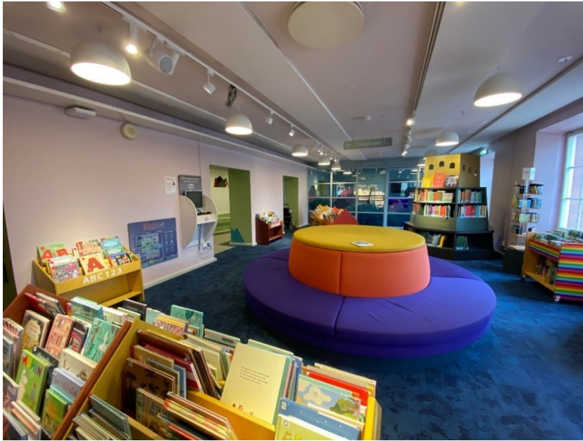
Bilde 9 - Delar av barneavdelinga i Malmö Stadsbibliotek