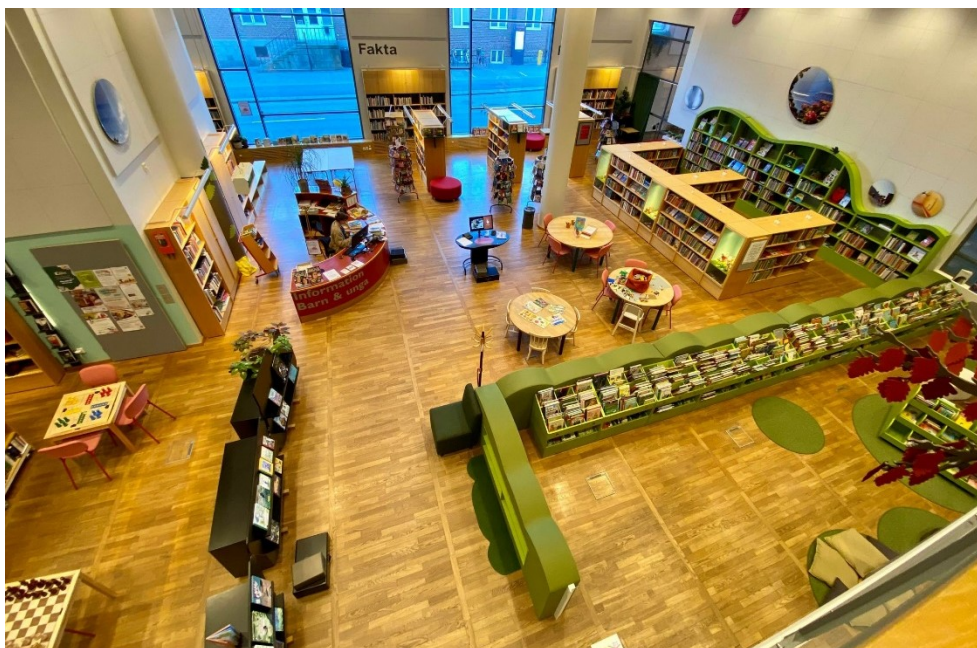
Bilde 1 – Barneavdelinga.

Under kan du sjå to bilde tatt i frå andre etasje som viser barneavdelinga og ungdomsavdelinga.