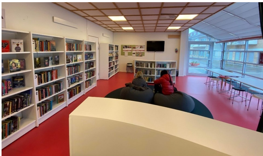
Bilde 19 - Ungdomsavdelinga i Bromölla bibliotek. Til høgre i bilde (ved borda nært vindauga) har dei gøye arrangement som t.d. After school og Teckning och måleri