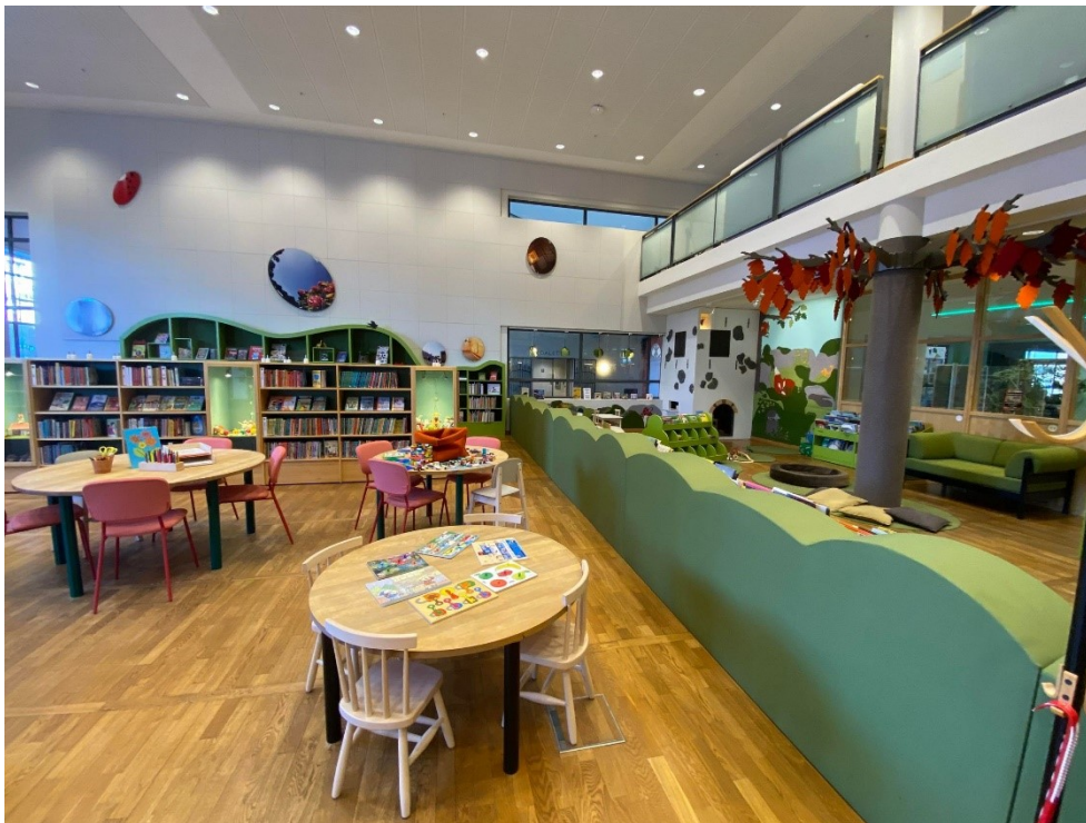
Bilde 3 - I småbarnsavdelinga (til høgre) har dei laga eit slott der Hovdala slott i Hässleholm har vore inspirasjonskjelda.