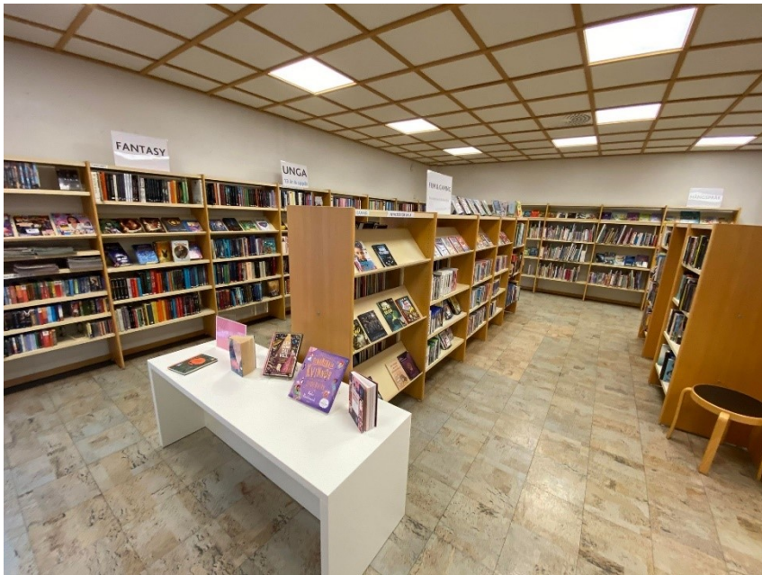
Bilde 18 - Delar av barne- og ungdomsavdelinga i Bromölla bibliotek