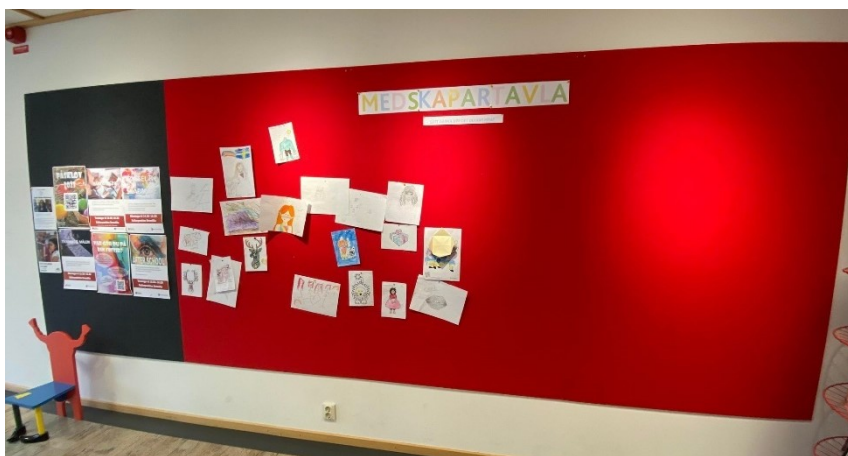
Bilde 16 - Medskapartavla i Bromölla bibliotek. Her kan barn og unge henge opp det dei har laga i biblioteket