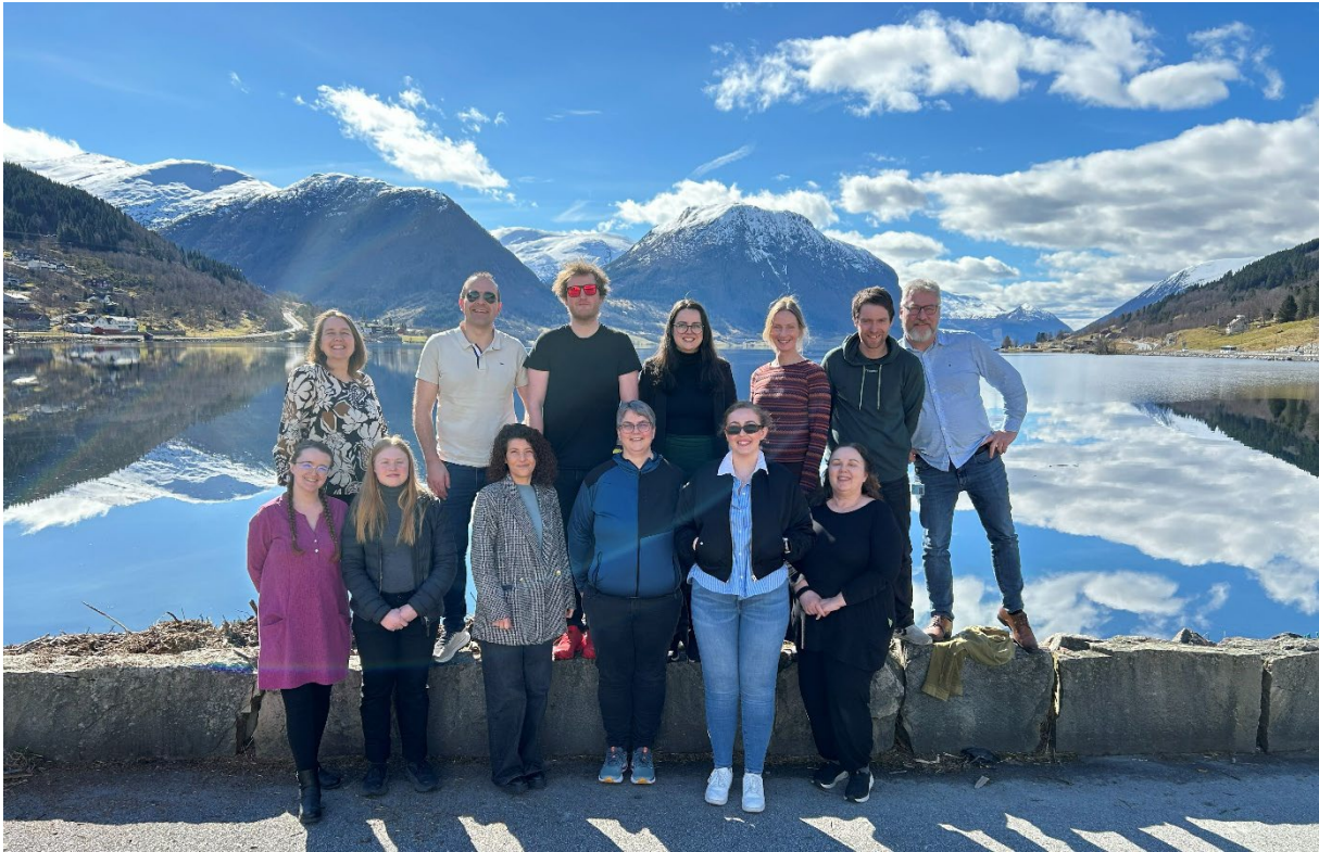
3 Dei tilsette ved KAV på Kommunearkivkonferanse i Skei våren 2025.

Alle som jobbar for KAV er tilsett i Vestland fylkeskommune. Gjennom gjeldande tenesteavtale disponerte KAV desse stillingsressursane i 2025: