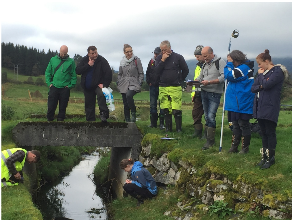
Synfaring i Gaular kommune.

Fleire av direktorata har tilskotsordningar som kan være aktuelle for å søke finansiering av overvaking og tiltaksgjennomføring m.m. Desse ordningane vil kunne bli endra frå år til år og det er difor ikkje føremålstenleg å gje ei samla oversikt då den fort blir utdatert. Miljødirektoratet har søknadsfrist 15. januar for fleire tilskotsordningar.