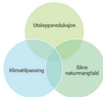
Figur 2: Hovudområda i Klimaomstilling

Regional klimaplan for Vestland er i prosess og vert handsama av fylkestinget hausten 2022. Planen skal gi grunnlag for klimaomstilling av Vestland fylke for å nå målet om eit samfunn med netto nullutslepp, som er planen sitt oppdrag. Dette inneber ei brei samfunnsending der vi både reduserer klimagassutsleppa, samtidig som vi tilpassar oss til dagens og framtida sitt klima, òg tek i vare naturmangfaldet.