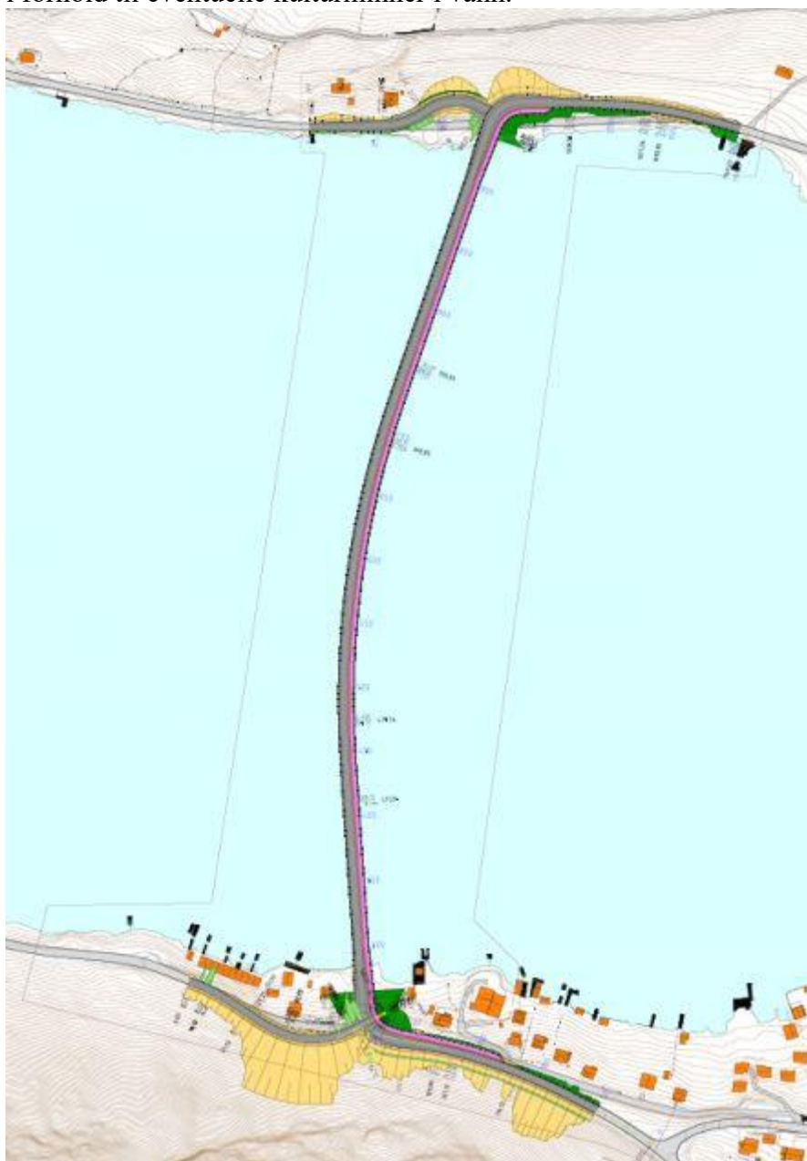
Figur 2: Planområdet. Kart: Vestland fylkeskommune.

Formålet med registreringene var å vurdere de foreslåtte reguleringsformålenes grad av konflikt i forhold til eventuelle kulturminner i vann.