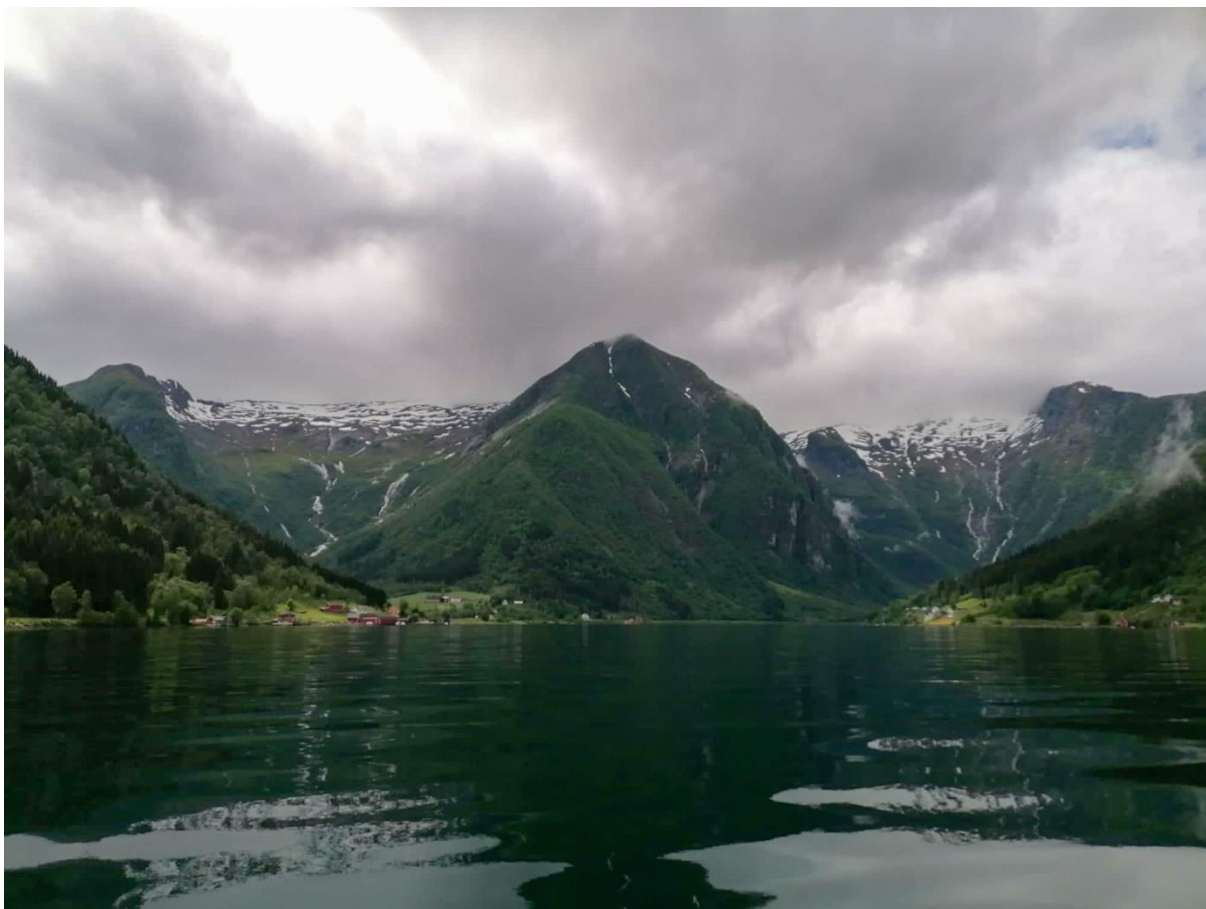
Figur 1. Bilde: Esefjorden