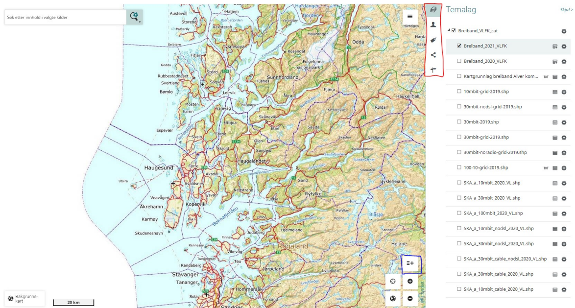
Figur 2: Brukargrensesnitt. Raud firkant er alternativ for visning og brukar. Blå firkant er knappen for redigeringsfunksjon.

Bredband_2021_VLFK er det temalaget som vert oppdatert ved innteikning. For å teikne inn nye polygon må ein trykke på ikonet i den blå ruta som er vist i figur 2 over her. Då får ein opp bilete som vist i figur 3.