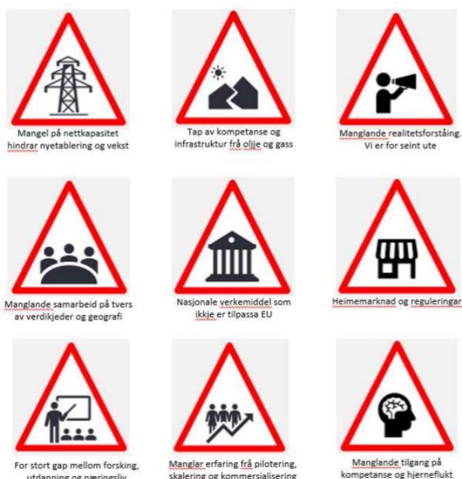
Figur 3 Varseltrekantane over viser dei største hindra for utvikling. (Kjelde: «Vestlandsscenarioer 2020 – Felles kunnskapsgrunnlag for en foretrukket fremtid», EY på oppdrag av Vestland Fylkeskommune, NHO, LO, KS, NAV, Bergen Næringsråd, Næringsalliansen i Hordaland, Sogn og Fjordane Næringsråd, Bergen kommune og Atheno)

Framlegg til regional plan for bærekraftig verdiskaping konkretiserer også ni hinder for utvikling: